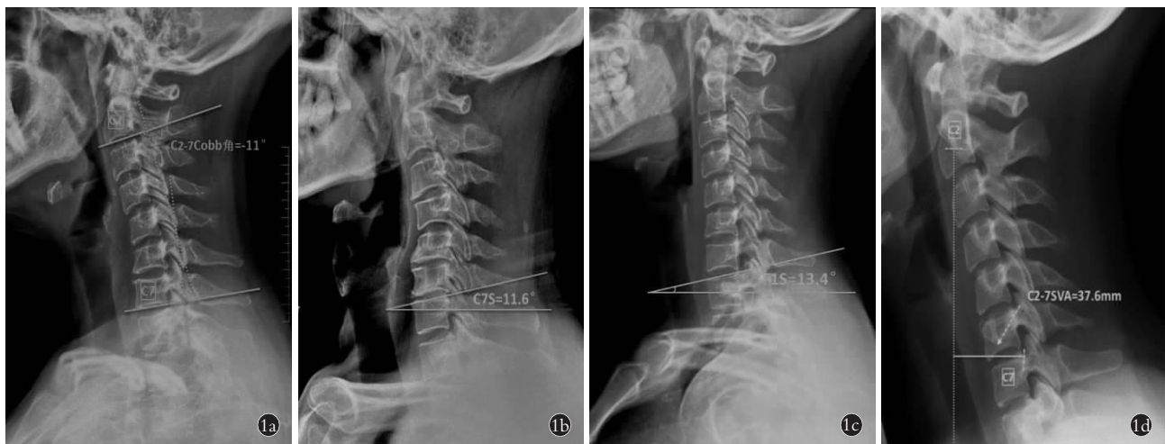
图 1 颈椎各参数的 X 线测量 1a. C 2 -C 7 Cobb 角测量 1b. C 7 S 角测量 1c. T 1 S 角测量 1d. C 2 -C 7 SVA 的测量